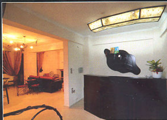
Ο χώρος υποδοχής